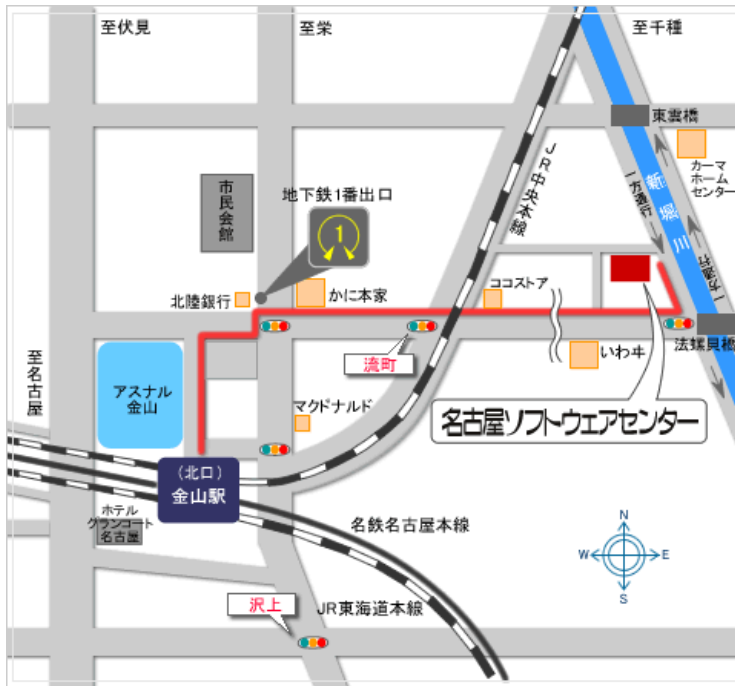
〔名古屋ソフトウェアセンターHPより転載〕