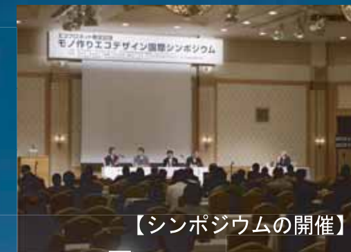
【シンポジウムの開催】